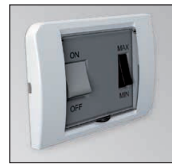
Incorporado en la instalación